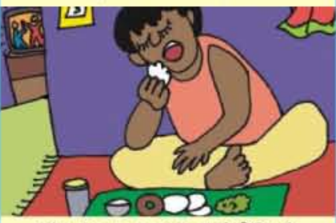
சத்துள்ள உணவை சாப்பிடுதல்