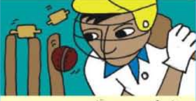
பாதுகாப்பு கவசங்களை அணிதல்