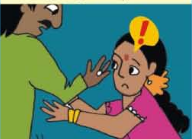
தற்காப்பிற்கு சத்தமிடுதல் / தள்ளி விடுதல்