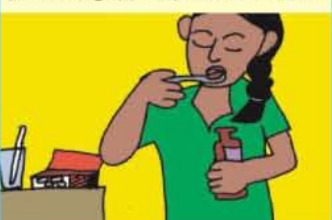
நோய்க்கு மருந்து சாப்பிடுதல்