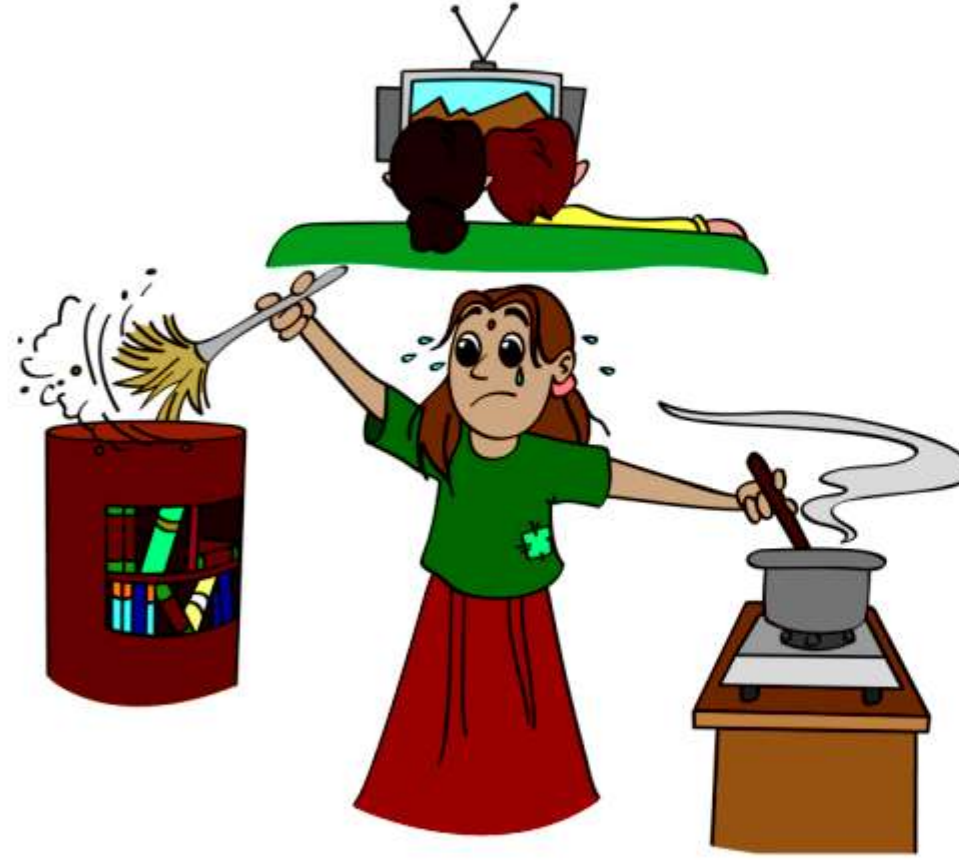
बच्चे को अपने घर में नौकर बनाकर रखना