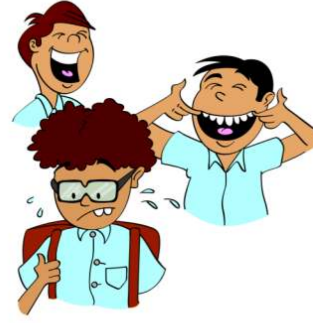
बच्चे का मज़ाक उड़ाना