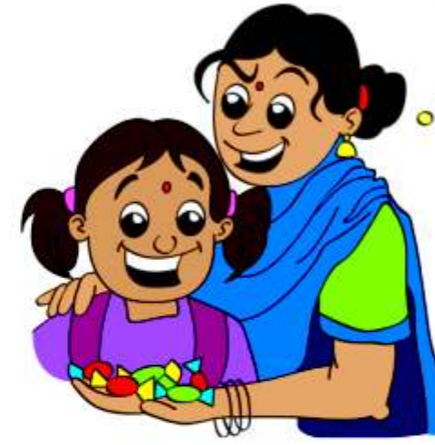
बच्चे से चालाकी करना