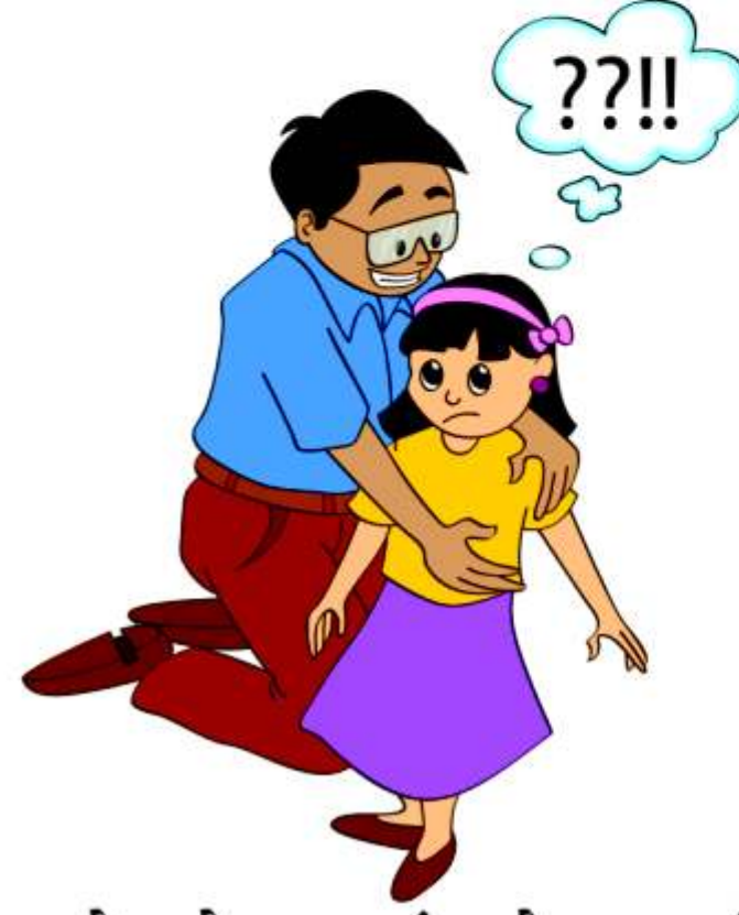
बच्चे को इस ढंग से छूना जिससे वो असहज, असुरक्षित या उलझन महसूस करे