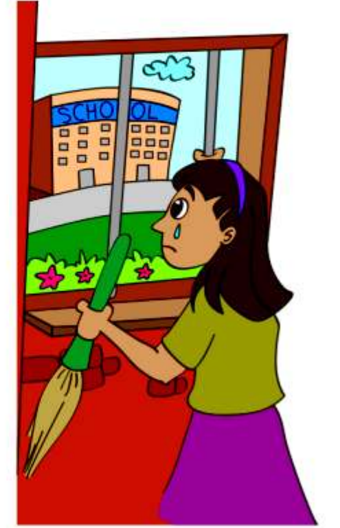
बच्चे को स्कूल ना जाने देना