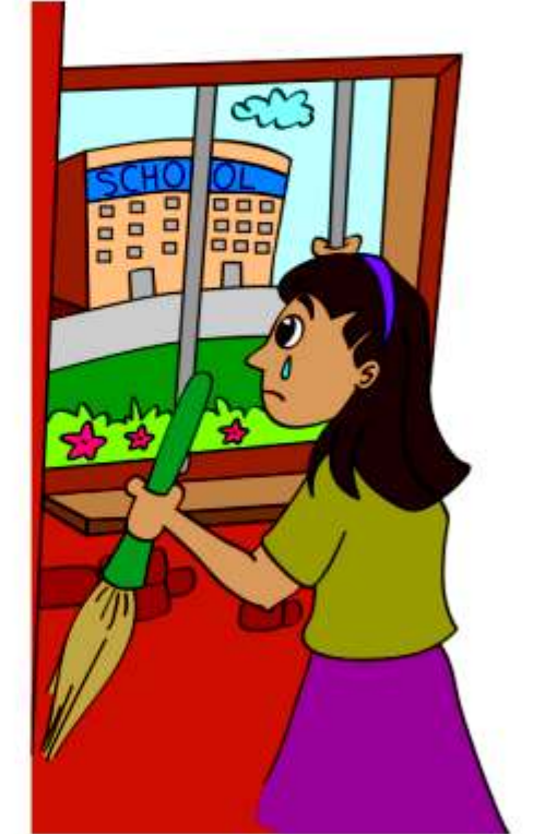
बच्चे को स्कूल ना जाने देना