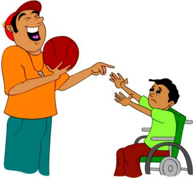
बच्चे का उपहास करना