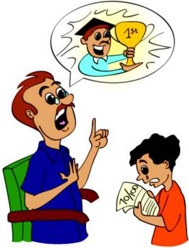
बड़ों की ज़रूरतों या अपेक्षाओं को पूरा करने के लिए बच्चे पर दबाव डालना