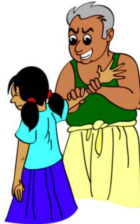
बच्चे को आपको छूने के लिए मजबूर करना