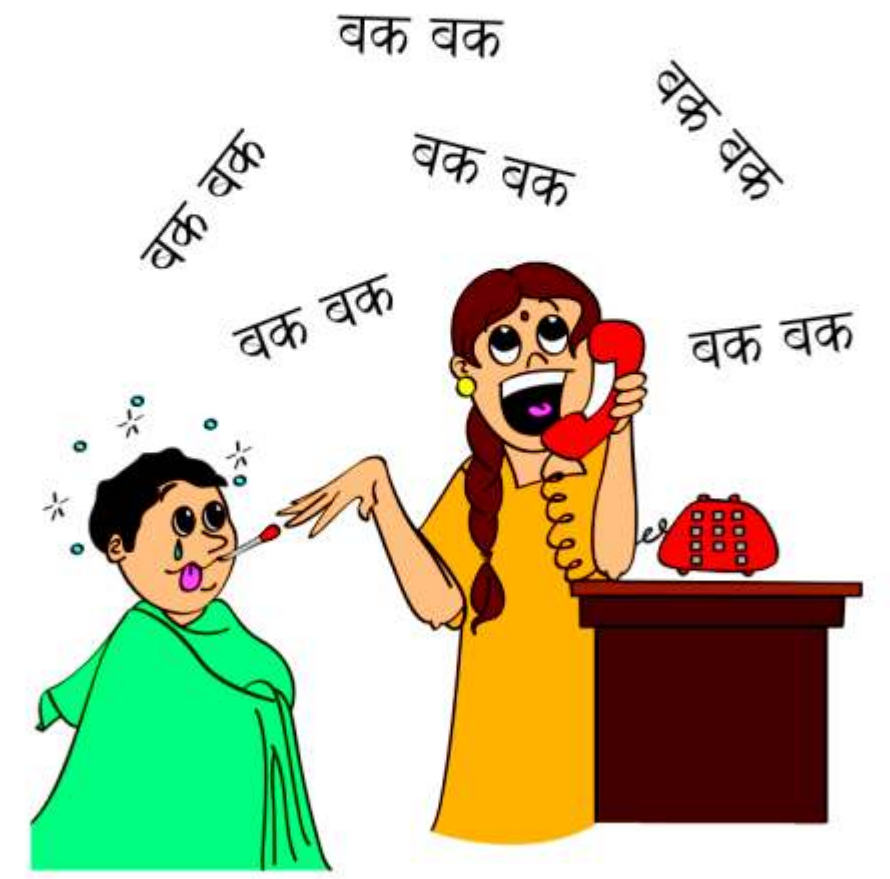
बच्चे के स्वास्थ्य की ज़रूरतों को अनदेखा करना