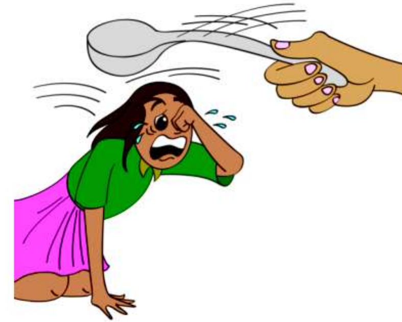
बच्चे को पीटना