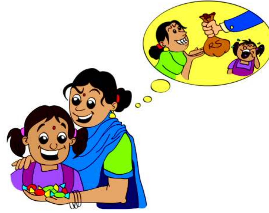
बच्चे से चालाकी करना