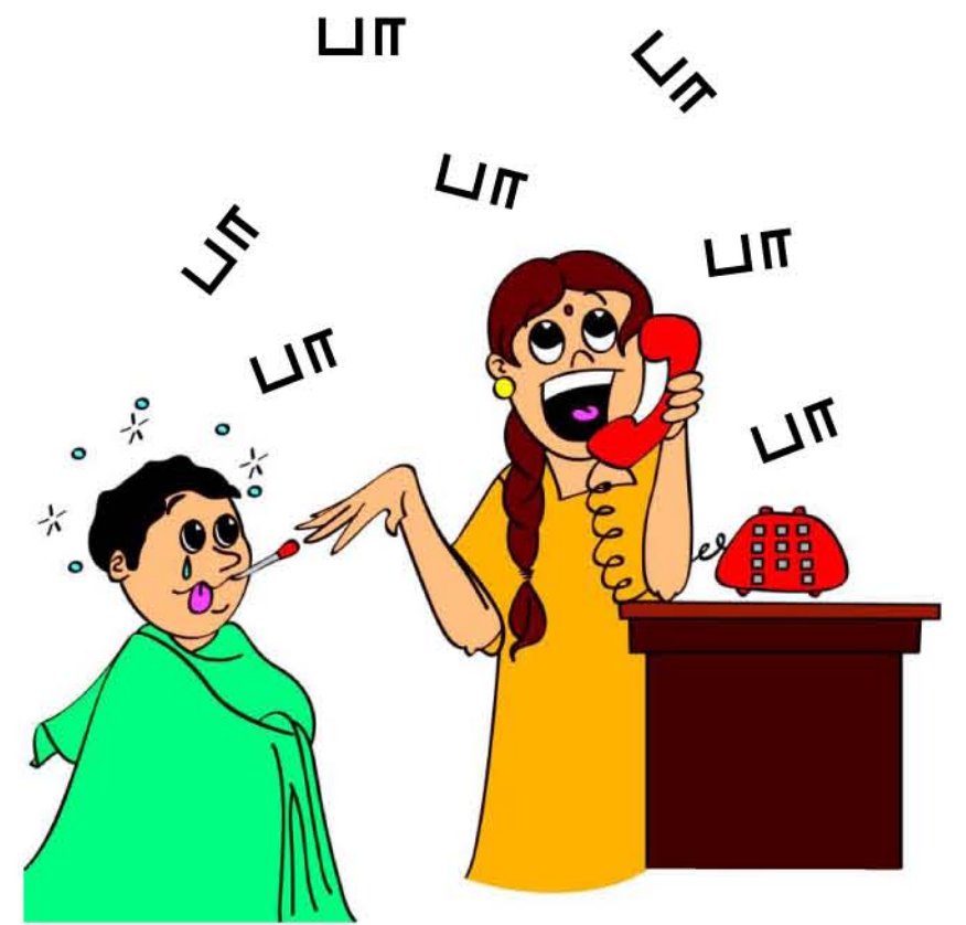
குழந்தையின் மருத்துவத் தேவையை நிறைவேற்றாமல் இருப்பது

குழந்தைக்கு குழப்பம், பாதுகாப்பற்ற உணர்வு, அசௌகரியத்தை ஏற்படுத்தும் வகையில் தொடுவது