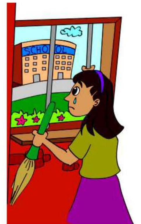
குழந்தை பள்ளிக்குச் செல்வதைத் தடுப்பது