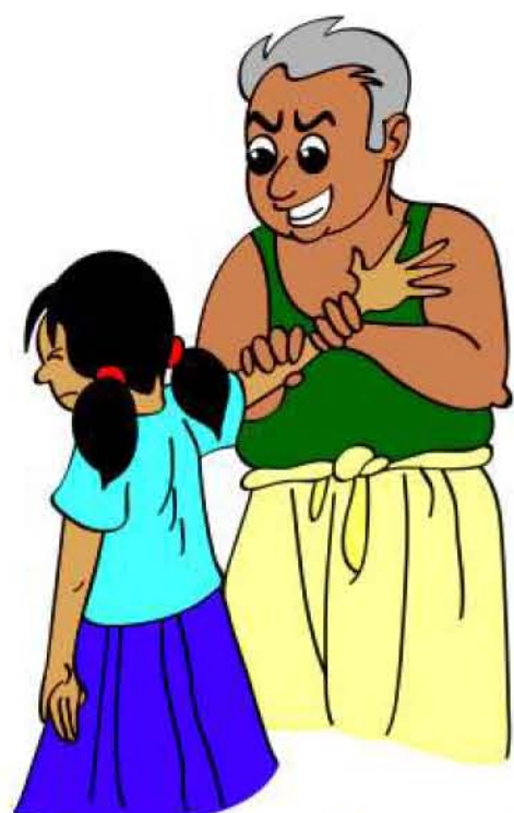
குழந்தையை தொடச் சொல்லி கட்டாயப்படுத்துவது